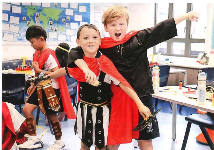
學生在課堂上透過角色扮演進行學習，十分有趣。