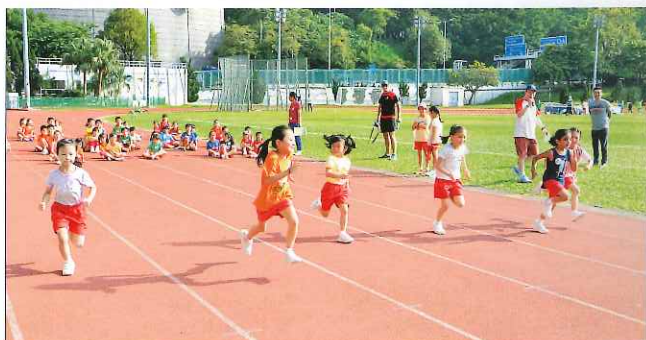
新加坡學制着重培養學生基本的語文和數學能力。