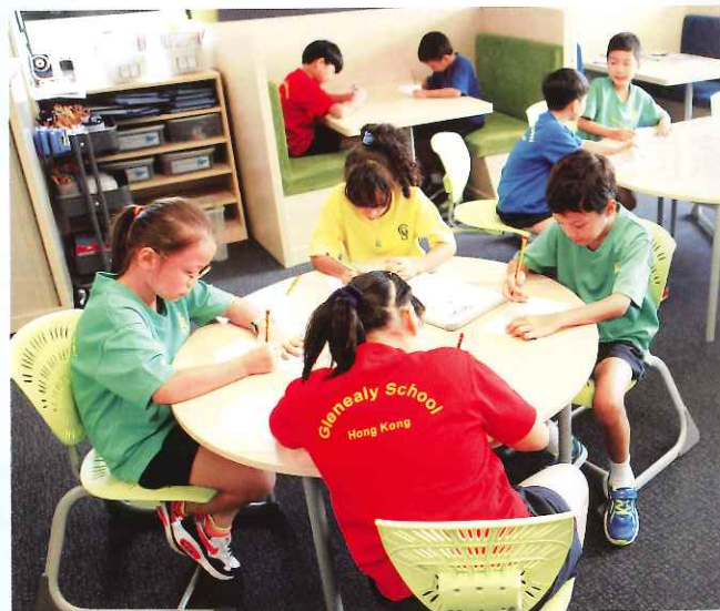
IB課程着重訓練學生的理解能力和批判性思考。