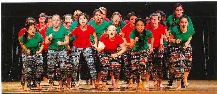
學生積極參加比賽和表演，發揮團隊精神。