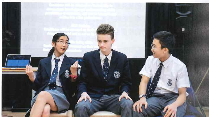
中學的科目選擇更多元化，例如是戲劇科。

課外活動更是學校培育學生領袖特質的重要部份，所以學校的領才計劃（Leadership in Action）中，會提供隊際和個人體育、音樂、美術、戲劇、文化、慈善和學術延伸活動，讓學生發展服務精神、團隊精神、創意表達、領導能力和自我挑戰等相關技能，亦能增強他們的自信心，應用在學習和待人接物上。另一方面，學校也為學生安排很多戶外體驗，讓學生跳出課室進行學習，如Year 3至Year 8的學生需要參加野外歷奇訓練營。高年級的學生更有機會到海外交流，如在老撾參與建屋義工服務、加拿大滑雪體驗和西班牙馬德里足球訓練等，讓學生能挑戰自我，學習新的知識和技巧，擴闊視野，從中有正面的成長。