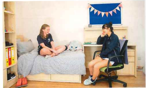
透過寄宿生活，學生可以學習與人相處的技巧。

「學校為學生設計的課程十分豐富，也給予學生很多支援和發揮的空間，例如多元化課外活動已融入於每日的上課時間表中，所以學生在校時間較長。現時小學部和中學部的放學時間分別為下午3:50及4:50，故我們不建議家長為學生安排額外的補習，反而希望他們回家後可以輕鬆一下，並享受優質的家庭時間。」