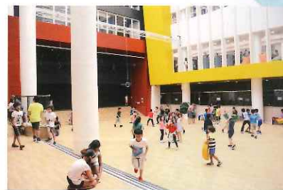
修讀德國學制的學生最少需選修7門課程，以確保他們能夠達致全面發展。