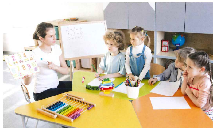
不少家長因認同教學理念一致，把子女送入IB學校就讀，讓學生無須在抄寫背誦情況下，學習知識。

學費開支也是家長必須要考慮之一，本地津貼小學免費，但辦 IB 課程以直資或國際學校為主，平均學費一年約 15 至 36 萬。學費以外，